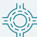
Materia de vías de comunicación